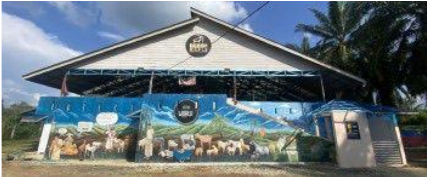
Bebiri World Berjaya memperkenalkan system pawah moden.

Berminat dalam bidang ternakan, namun tinggal di kawasan bandar menjadi kekangan utama kerana ketiadaan tanah dan persekitaran tidak sesuai untuk berbuat demikian, selain keperluan modal yang tinggi.